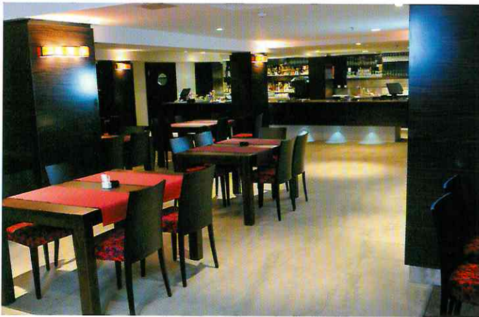
ACCÈS AUX RESTAURANTS

Pour des malvoyants, un manque de contraste peut être une source de danger potentiel. Tous les lieux amenés à recevoir du public sont concernés.